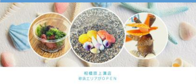
相模原上溝店 相模原市上溝4丁目9-11